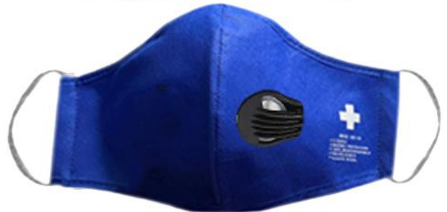
Características Técnicas Específicas de la Careta Protectora, MaskPlash Air.